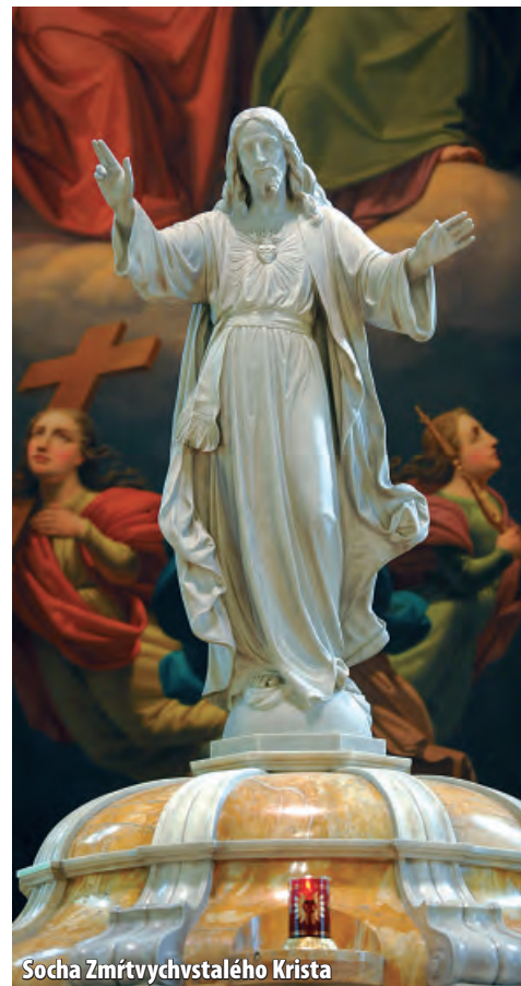
Socha Zmŕtvychvstalého Krista

20. storočie bolo taktiež v znamení úprav Burianovej veže. Táto v roku 1941 dostala vyhladkovú ochodzu na jej vrchu. Už skôr, v roku 1923 do jej vnútra pribudli nové zvony, prinesené za slávnostného sprievodu mestom. Pôvodné zvony boli zhabané na účely 1. sv. vojny. Zvony z roku 1923 slúžia svojim zvonením dodnes. Je ich 6, najväčší nesie meno Najsvätejšia Trojica a váží 2785 kg.