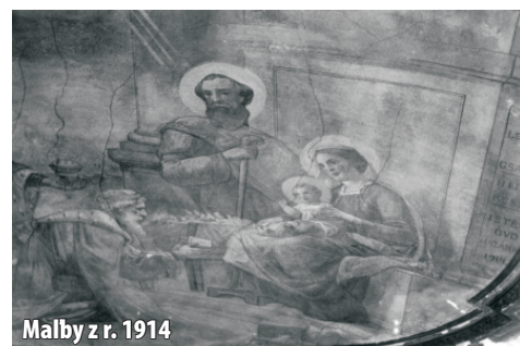
Malby z r. 1914