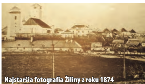
Najstaršia fotografia Žiliny z roku 1874