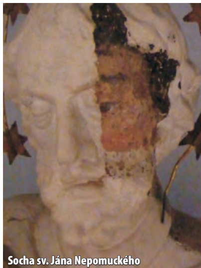
Socha sv. Jána Nepomuckého