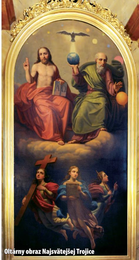
Altárny obraz Najsvätejšej Trojice