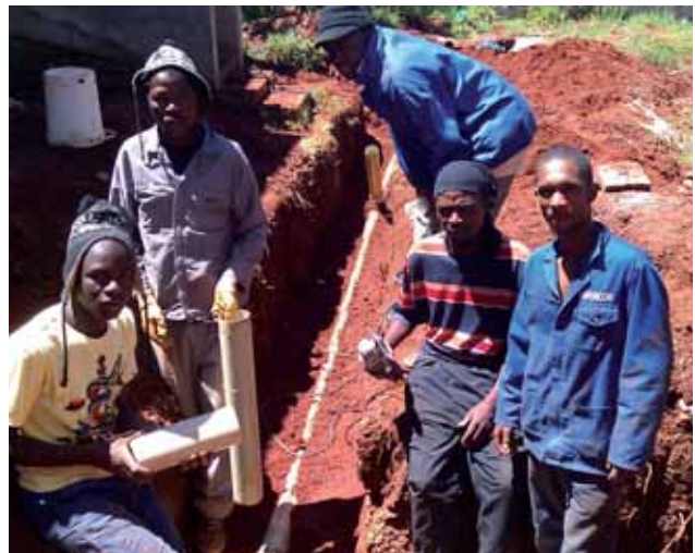
UČNI Z UČŇOVSKÉHO REKVALIFIKAČNÉHO CENTRA

Na svoje prvé dojmy po príchode do Afriky a neznáma si spomína takto: „Na začiatku je hlavne všetko, všetko nové a iné. Človek si musí zvykať na mnoho vecí, napríklad, že nemôže z bezpečnostných dôvodov za žiadnych okolností vyjsť v noci na ulicu, alebo navyknúť si na sucho a prach všade okolo, len kde-tu s náznakmi zelene. Známe je, že Afričania majú na všetko čas, hodinky nosia bez bateriek, sú len súčasťou imidžu, a to nám, časovo a výkonovo orientovaným Európanom určite nejakú dobu zvyšuje krvný tlak...“