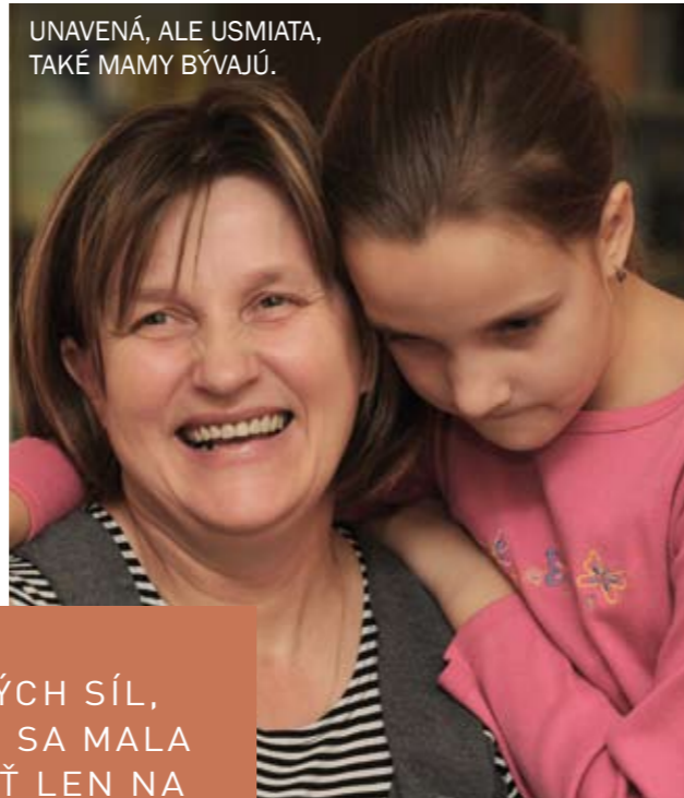
UNAVENÁ, ALE USMIATA, TAKÉ MAMY BÝVAJÚ.

Prebrali sme ešte veľa vecí – od boja o kúpeľňu (je zrejmé, že dievčatá potrebujú viac času, ale pravidlo je zbytočne nezdržiavať), až po pichľavé poznámky okolia. „Napokon však vždy ľudia zdieľajú naše očakávanie