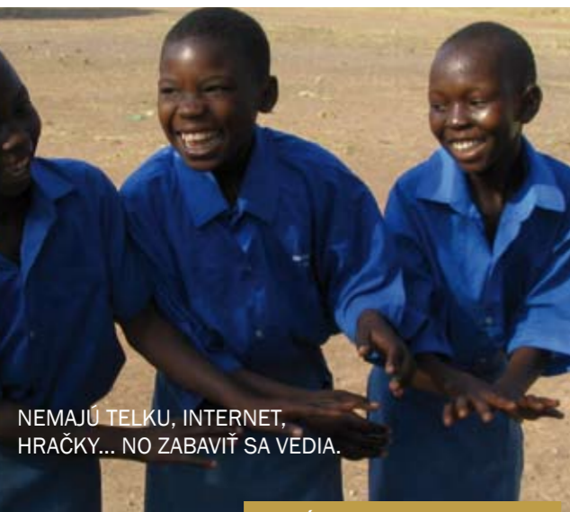
NEMAJÚ TELKU, INTERNET, HRAČKY... NO ZABAVIŤ SA VEDIA.