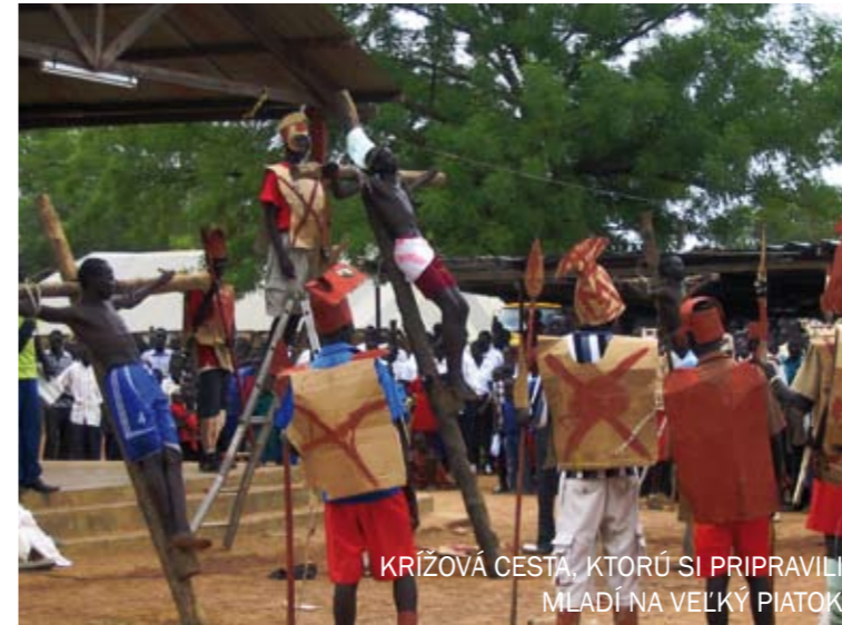
KRÍŽOVÁ CESTA, KTORÚ SI PRIPRAVILI MLADÍ NA VEĽKÝ PIATOK

Prichádzali už od skorého rána, keď ešte mali spať, alebo aj neskôr, keď už mali byť v škole. Dievčatá a aj niektorí chlapci sa nevedeli ubrániť slzám, ich oči vyjadrovali prekvapenie, dojatie a neistotu. No rozchádzali sme sa so želaním Božieho požehnania a nádejou na ďalšie stretnutie. Z Kene ešte bola možnosť poslať im cez Moniku mail a ako odpoveď nám poslali po Monike nádherné listy plné vyjadrení vďaky, túžby po ďalšom stretnutí. V žiadnom z listov nechýbalo aj poďakovanie ľuďom zo